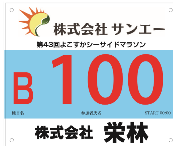
※ゼッケンイメージ